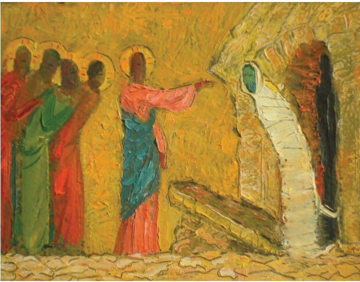
Александр Лепетухин «Воскрешение Лазаря» (из цикла «Путь»), 2010

тут важно понимать, что пока мы задаем вопрос Богу: за что мне это, почему я не могу жить по-другому, мы забываем одну важную вещь, что во власти Христа воскресить даже умершего. Мы просим Бога, а когда Он не приходит, мы почему-то думаем, что Он нас не слышит. Но в случае с Лазарем мы видим, что промедление Бога было для чего-то нужно. Это важно помнить, понимать, просить Бога о воскрешении человека непрерывно. Даже если Он не приходит сразу. Надо понять, почему Он не приходит сиюминутно. Вернее, для чего?