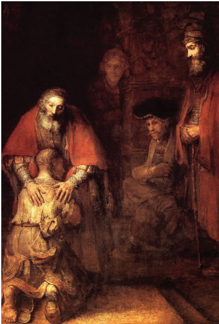
Рембрандт. «Возвращение блудного сына» (фрагмент)

тех, которые долго сидят за вином, которые приходят отыскивать вина приправленного. Не смотри на вино, как оно краснеет, как оно искрится в чаше, как оно ухаживается ровно: впоследствии, как змей, оно укусит, и ужалит, как аспид;... и ты будешь, как спящий среди моря и как спящий на вершине мачты. И скажешь: «били меня, мне не было больно; толкали меня, я не чувствовал. Когда проснусь, опять буду искать того же».