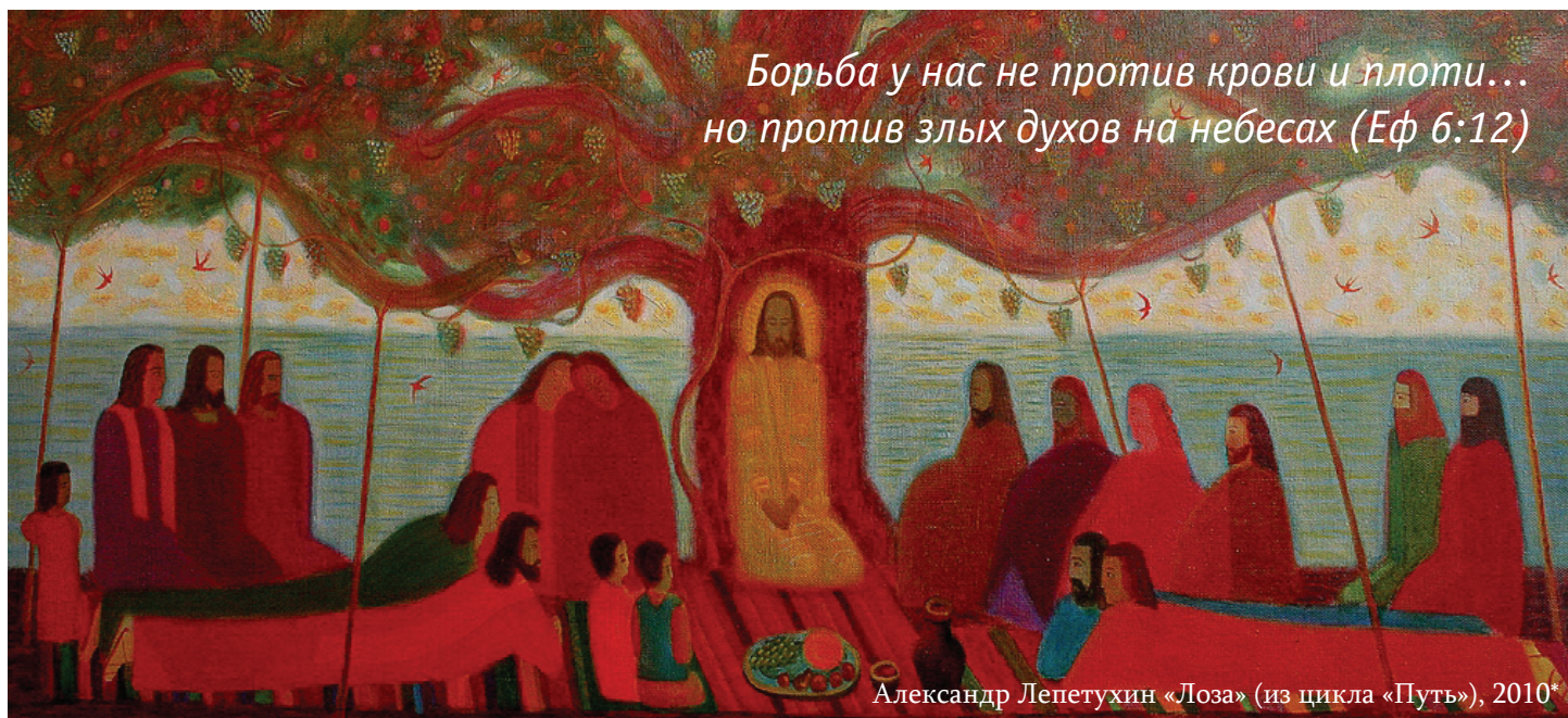
Александр Лепетухин «Лоза» (из цикла «Путь»), 2010*

Борьба у нас не против крови и плоти... но против злых духов на небесах (Еф 6:12)